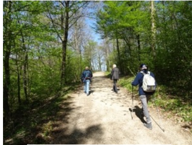
Der gemächliche Aufstieg