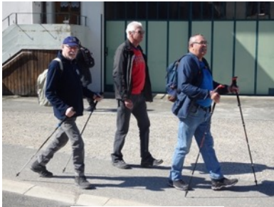
Das sind die Drei

Ein wunderbarer Frühlingstag erwartete uns bei der ersten Ganztageswanderung im 2022. Die Drei Musketiere und d' Artagnan möchten wir das Quartett bezeichnen welches sich zu dieser Wanderung aufrufften. Von Läuelfingen her strebten wir auf einem gemächlichen Aufstieg, welcher noch zulegte, der Ruine Homburg entgegen. Wandernd haben wir über Infotafeln erfahren wie die Ritter lebten, was sie assen und tranken, wie sie wohnten, wie sie sich kleideten, was es mit ihren Wappen und Rüstungen auf sich hatte und wie sie Fehden austrugen. Oben auf der Burg wurden wir mit einer herrlichen Aussicht belohnt. Trotz Abkürzungen hat sich d' Artagnan entschlossen den weiteren Weg zu nehmen, was sich im Endeffekt als mühsam herausstellte. Man hätte halt doch auf die drei Musketiere hören sollen. Doch alle Wege führen nach Rom. Auch wir haben das Restaurant Bad Ramsach erreicht. Wo auf uns kulinarische Leckerbissen warteten. Nach dem Mittagessen ging es nach einem kurzen Aufstieg nur noch bergab. Somit endet ein unterhaltsamer Wandertag wieder in Läuelfingen.