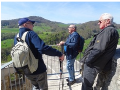
Nach der Eroberung