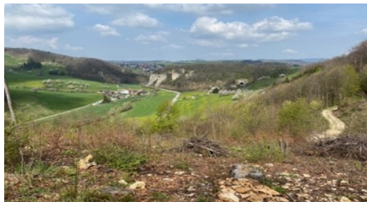
Der Blick in das Homburger Tal