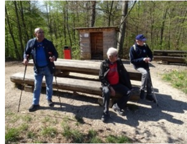
Jede Pause war willkommen