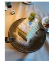
Die kulinarischen Köstlichkeiten, fast wie die Rittersmahlzeiten nur hatten wir Gabeln